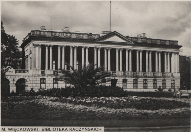
M. WIĘCKOWSKI: BIBLIOTEKA RACZYŃSKICH