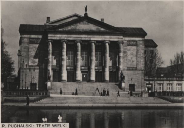
R. PUCHALSKI: TEATR WIELKI