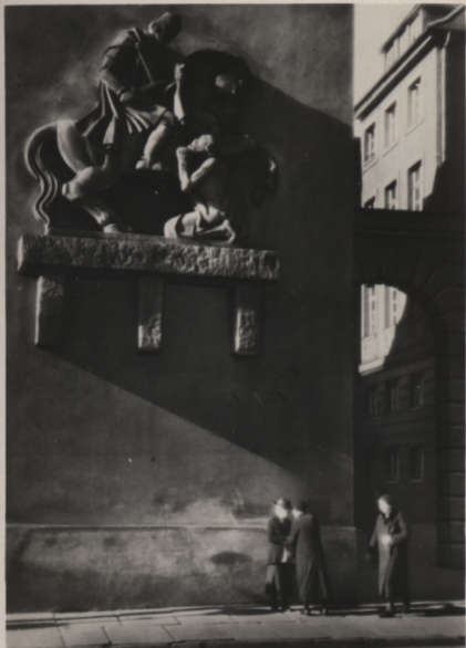
R. PUCHALSKI: FRAGMENT ŚW. MARCINA