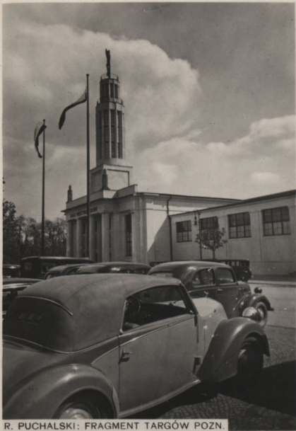
R. PUCHALSKI: FRAGMENT TARGÓW POZN.