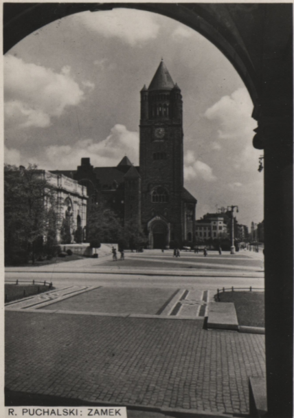
R. PUCHALSKI: ZAMEK