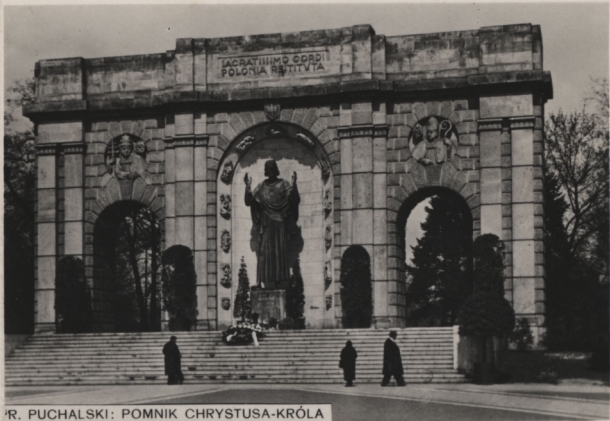
R. PUCHALSKI: POMNIK CHRYSYUSA-KRÓLA