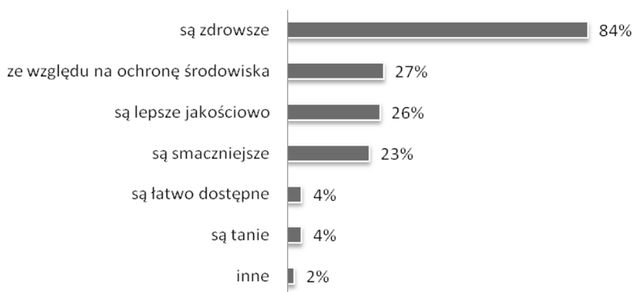
Rysunek 3. Motywy kupowania produktów ekologicznych