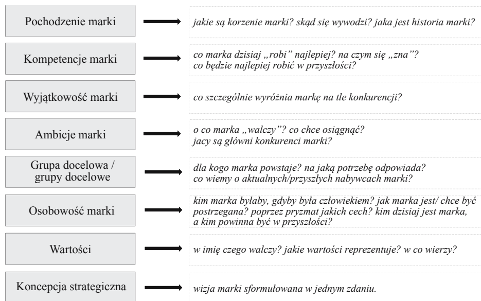
Rysunek 1. Brand Foundations – strategia marki wg firmy Corporate Profiles Consulting