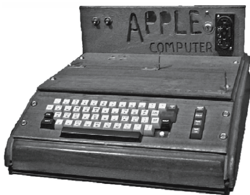
Apple-1 (1976 r.)

W nowoczesnym podejściu do systemu identyfikacji wizualnej pojęcie to rozciąga się na inne, do tej pory pomijane obszary. Na przykład coraz większy nacisk kładzie się na estetykę produktów oraz ich opakowań (por. rysunek 4). Jak twierdzi Moira Cullen, „design odgrywa fundamentalną rolę w kreowaniu marek; projekt wyodrębnia i uosabia rzeczy nieuchwytnie – emocje, kontekst, istotę, które mają największe znaczenie dla konsumentów” [Wheeler, 2010, s. 4].