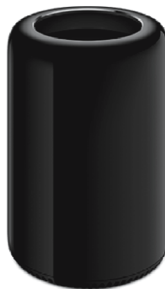
Mac Pro (2014 r.)