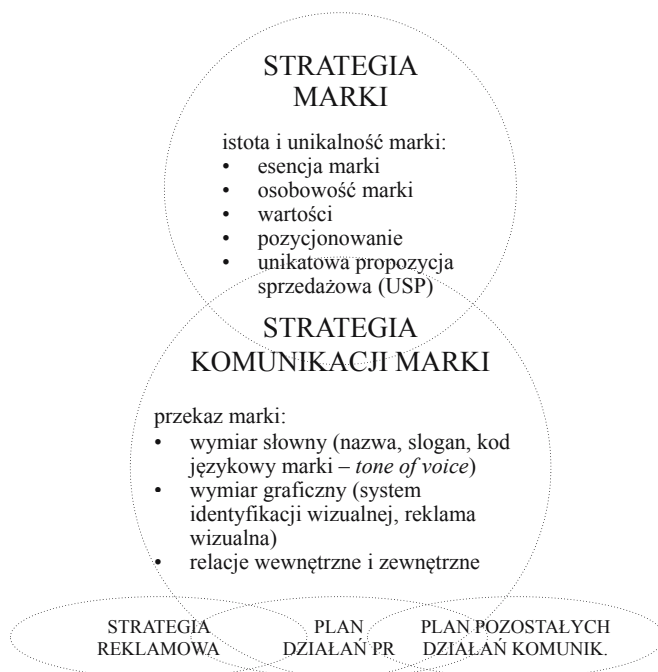
Rysunek 3. Strategia marki a strategia komunikacji marki

Komunikacja na poziomie werbalnym to specyficzny język marki, jej wymiar słowny. Najbardziej oczywistym elementem tego języka jest nazwa marki, która powinna odbiorcom czytelnie prezentować esencję marki. Oprócz wyboru nazwy marki i sloganu należy ustalić tzw. kod językowy marki ( tone of voice ), który jest zbiorem reguł rządzących stylem komunikacji werbalnej. Chodzi na przykład o dobór słownictwa używanego w komunikacji marki, sposób pisania tekstów reklamowych, itp.