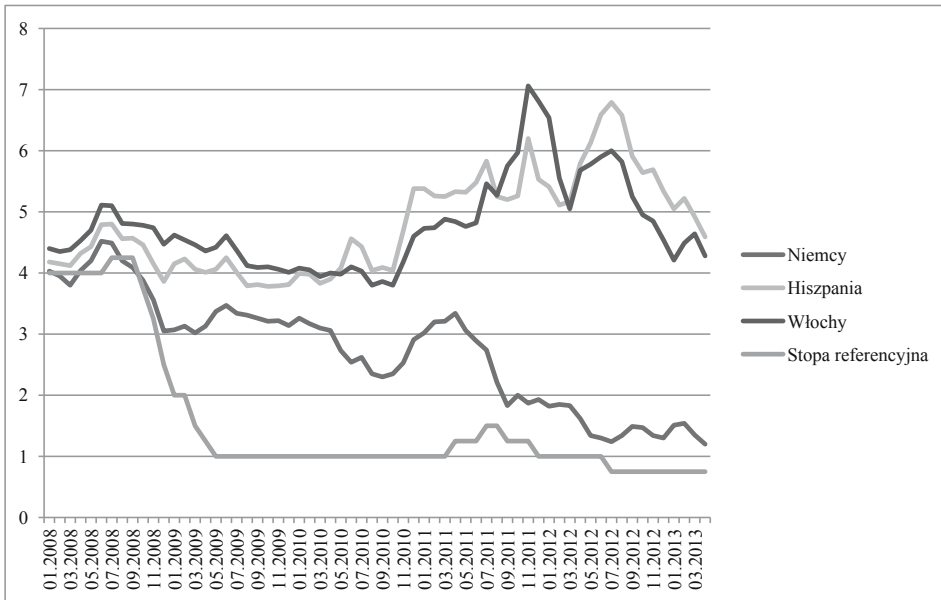
Rysunek 2. Stopy referencyjne EBC i rentowność rządowych papierów dłużnych wybranych państw strefy euro w okresie styczeń 2008–marzec 2013 roku (w %)

gospodarczej w strefie euro, stopy procentowe EBC zwiększono o 25 punktów bazowych. Do następnej takiej podwyżki doszło 13 listopada 2011 roku. 9 listopada 2011 roku rozpoczęły się natomiast kolejny okres obniżek stóp procentowych. W wyniku czterech decyzji stopa referencyjna została zredukowana o 100 punktów bazowych, zaś stopa depozytowa osiągnęła poziom 0%. W ten sposób stopy procentowe w strefie euro osiągnęły historyczne minimum.