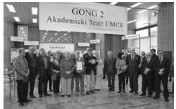
Uroczyste otwarcie wystawy pt. „Gong 2. Teatr – Próba – Spektakl”