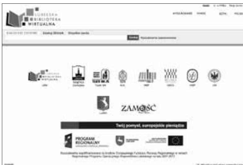
Portal centralny Lubelskiej Biblioteki Wirtualnej

w bibliotekach Lublina i Lubelszczyzny, wiązało się z koniecznością: stworzenia infrastruktury sieciowej łączącej Partnerów Projektu, digitalizacji ich zasobów bibliotecznych oraz wdrożenia oprogramowania organizującego te zasoby w formie bibliotek cyfrowych, stworzenia u większości Partnerów pracowni wyposażonych w odpowiedni sprzęt bądź doposażenia pracowni już funkcjonujących. Zasadnicze znaczenie miało przeprowadzenie digitalizacji zbiorów na warunkach outsourcingu, tą drogą wprowadzono do publicznego dostępu ponad 3 mln stron materiałów. Stanowiło to 38% wy-