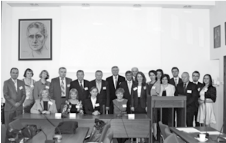
Fot. Michał Caban