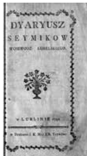
Z kolekcji starodruków Biblioteki Głównej UMCS