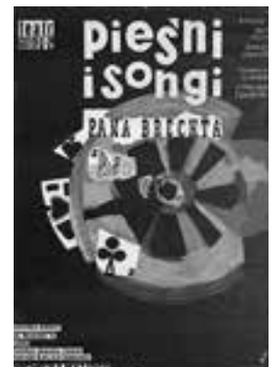
Projekt: Leon Barański