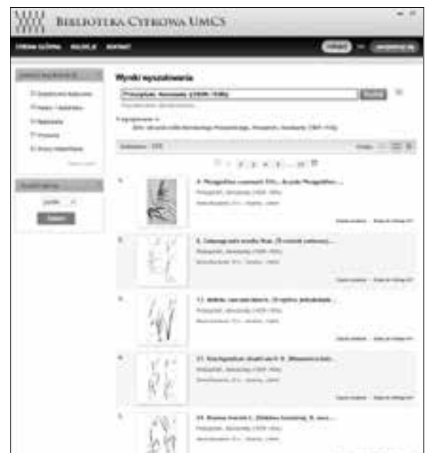
Kolekcja 255 akwrel Konstantego Prószyńskiego ze zbiorów Zakładu Botaniki i Mykologii UMCS

Digitalizacja wynikająca z uczestnictwa w Projekcie pozwoliła na powiększenie Biblioteki Cyfrowej UMCS o ponad 10 tys. obiektów, wprowadzono: 353 starodruki, 256 obiektów ikonograficznych, 189 pozycji kartograficznych, 202 tytuły czasopism oraz książki z XIX i początku XX w. zagrożone zniszczeniem ze względu na wykorzystywany w produkcji wydawniczej kwaśny papier. Zbiór wprowadzonych do BC UMCS książek objął: ▶