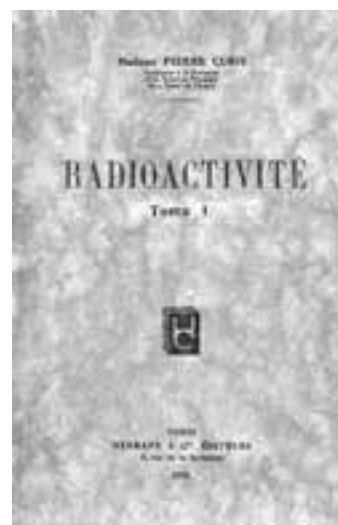
Pośmiertne wydanie wykładów wygłoszonych na Sorbonie przez Marię Skłodowską-Curie