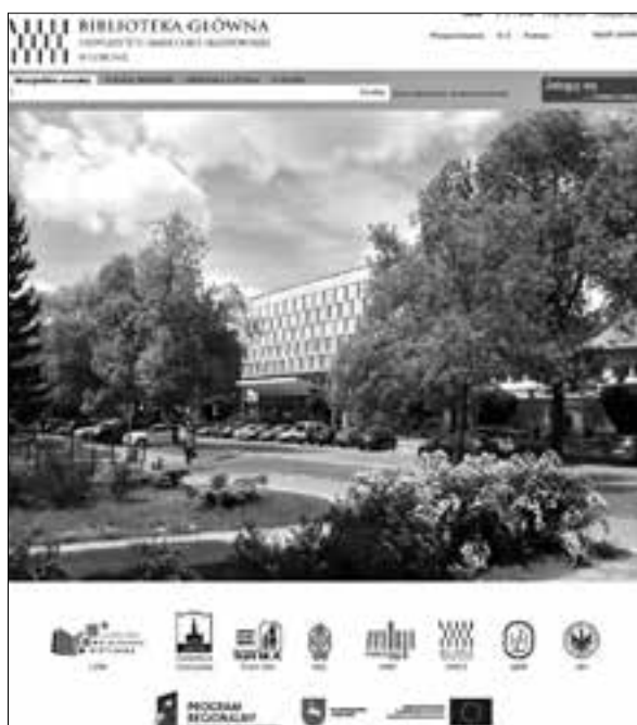
Wyszukiwarka naukowa Primo UMCS

Głównym elementem przedsięwzięcia było wdrożenie multiwyszukiwarki, indeksującej i przeszukującej zasoby tworzone przez instytucje partnerskie, pozyskiwane przez nie na warunkach umów licencyjnych, jak też otwarte zasoby Internetu, które biblioteki zalecają swoim użytkownikom do wykorzystania w realizowanych pracach. Takim systemem indeksującym metadane z wielu bezpośrednio niewspółpracujących ze sobą i często niekompatybilnych systemów, na którym oparto funkcjonowanie LBW, jest wyszukiwarka naukowa Primo. Portal centralny Lubelskiej Biblioteki Wirtualnej znajduje się pod adresem: www.lbw.lublin.eu . Osobne instancje dla partnerów są dostępne zarówno pod wymienionym adresem, jak też na stronach internetowych bibliotek partnerskich. Z witryny każdej z tych instancji jest możliwe przechodzenie do porta-