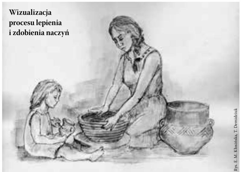
Wizualizacja procesu lepienia i zdobienia naczyń