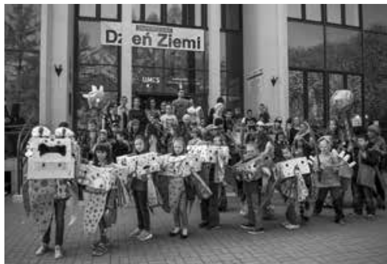
Fot. Robert Frączek