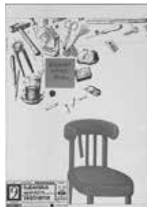
Projekt: Grzegorz Sądecki